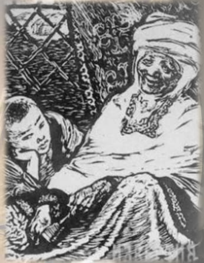
Абай әжемен бірге